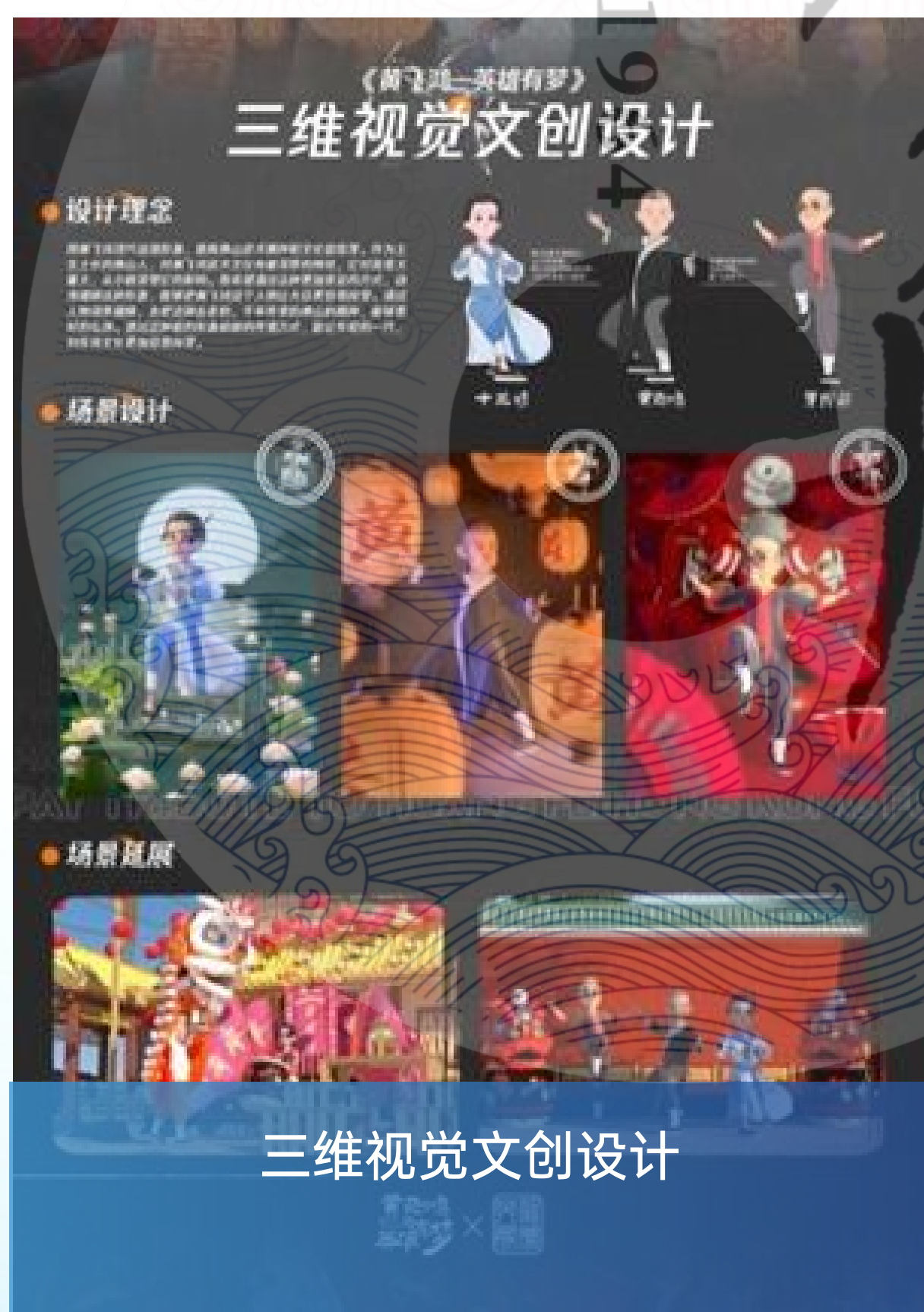
三维视觉文创设计