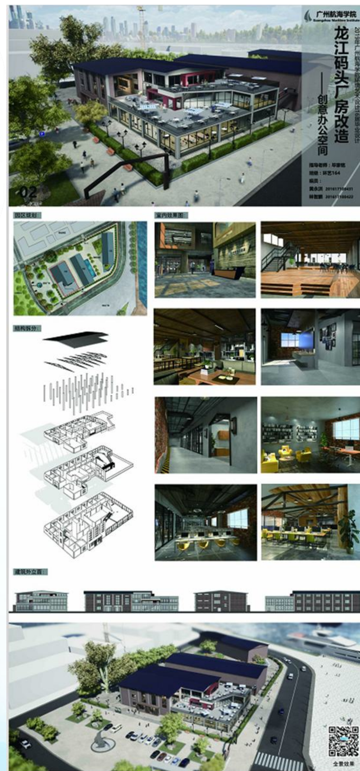
创意办公空间设计