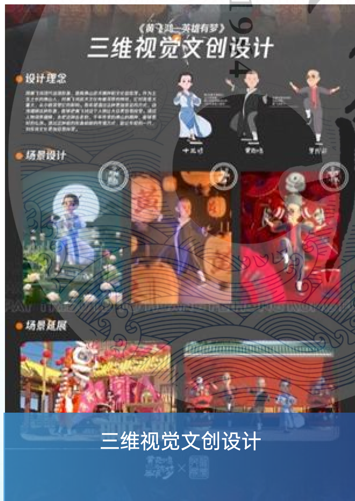
三维视觉文创设计