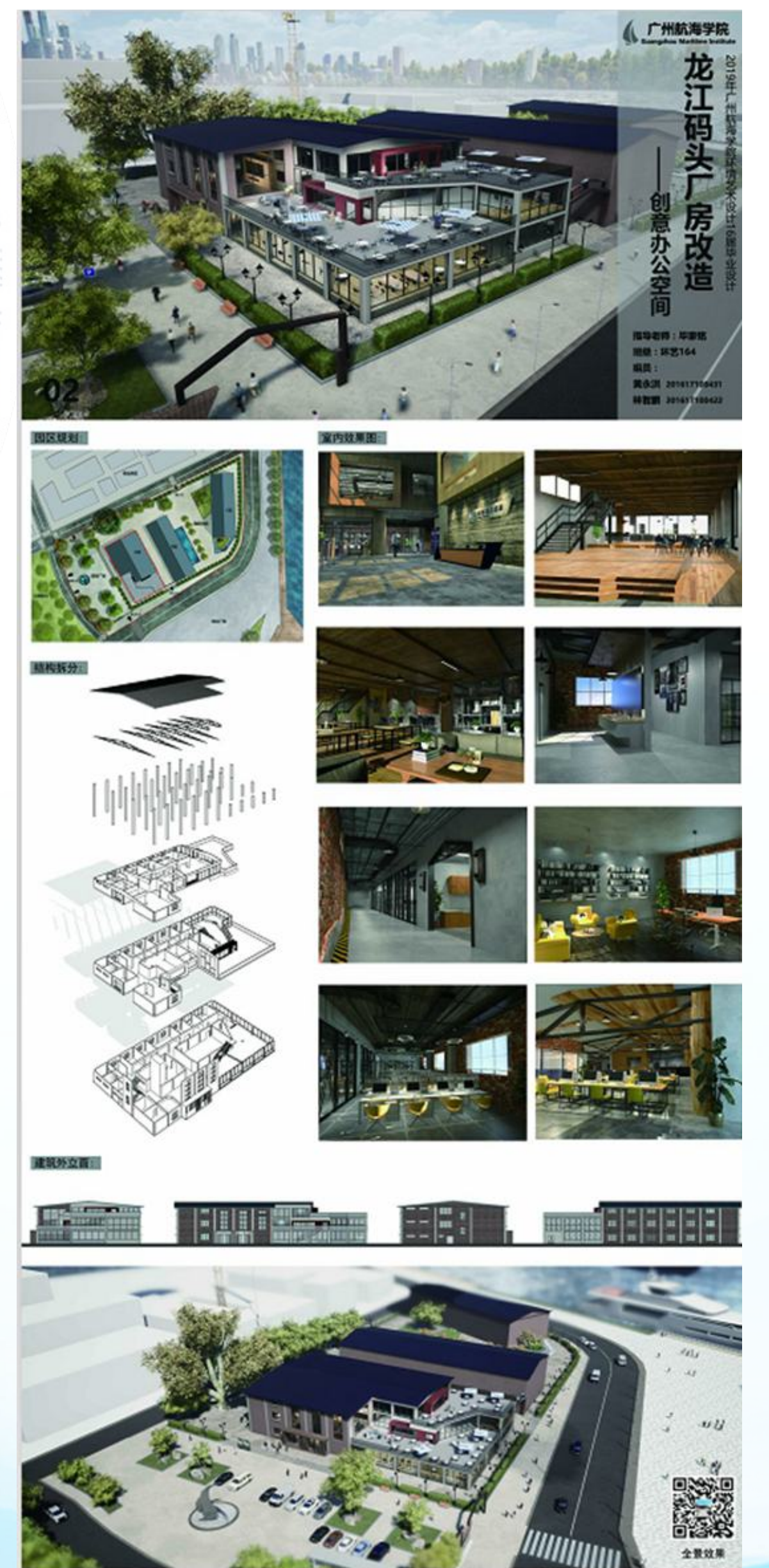
创意办公空间设计