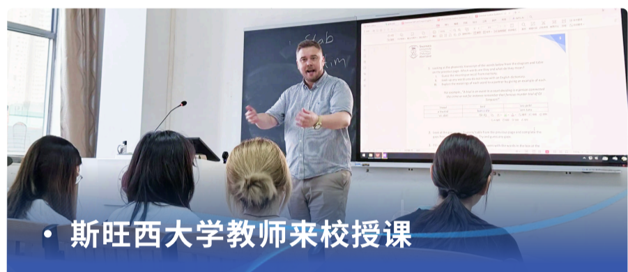
• 斯旺西大学教师来校授课

斯旺西大学建校于1920年，位于斯旺西市中心地带，是英国少有独立校园区的花园海滨式大学，现有学生20000余名，2026年QS世界大学排行榜中位列292位。