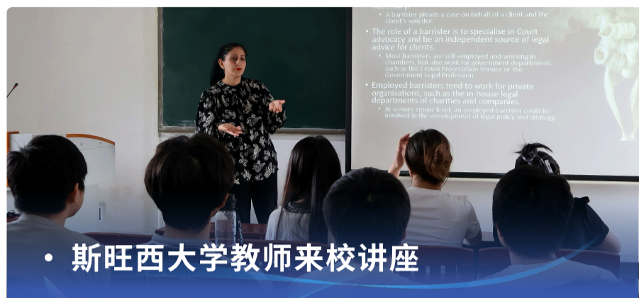
• 斯旺西大学教师来校讲座