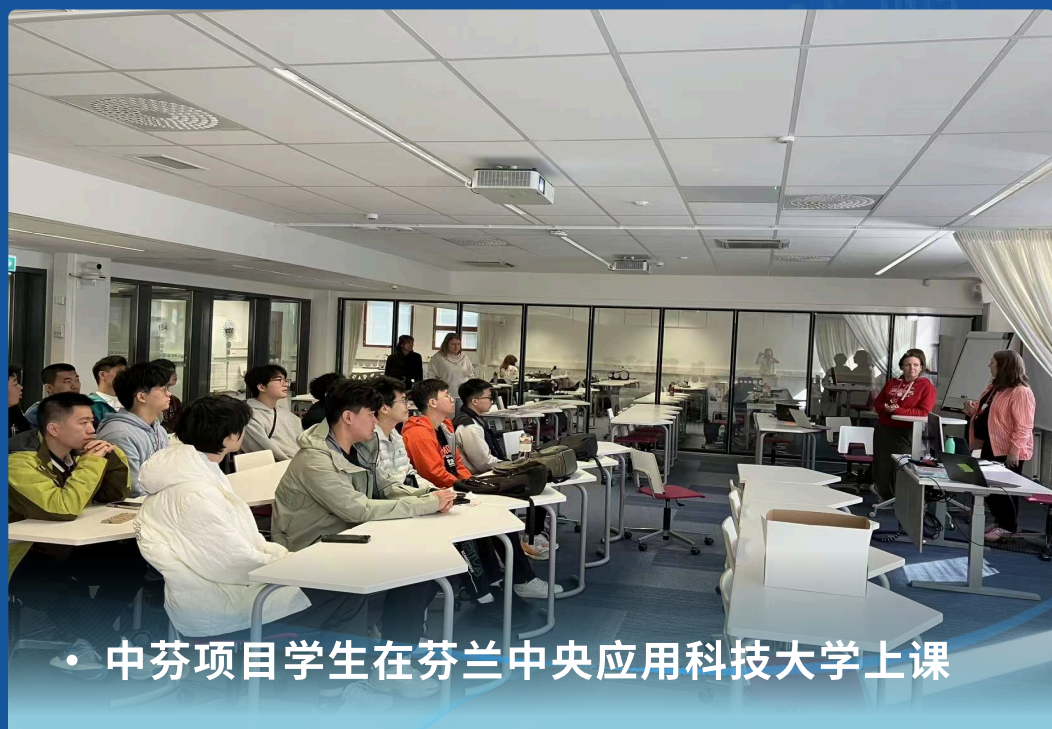
中芬项目学生在芬兰中央应用科技大学上课

芬兰中央应用科技大学 / CENTRIA UNIVERSITY OF APPLIED SCIENCES, FINLAND