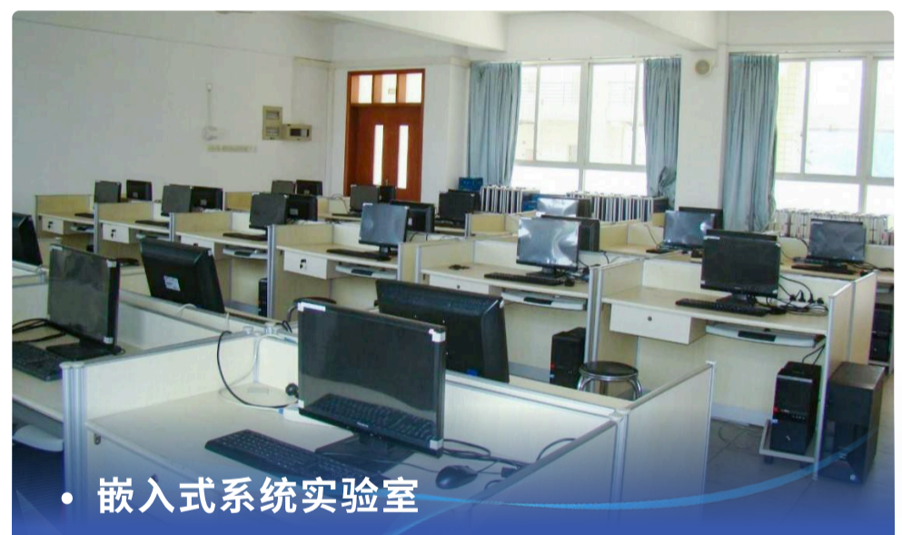
• 嵌入式系统实验室

移动通信运营商、网络产品或电子产品开发企业、软件开发和信息服务企业、低空装备开发或运维企业。