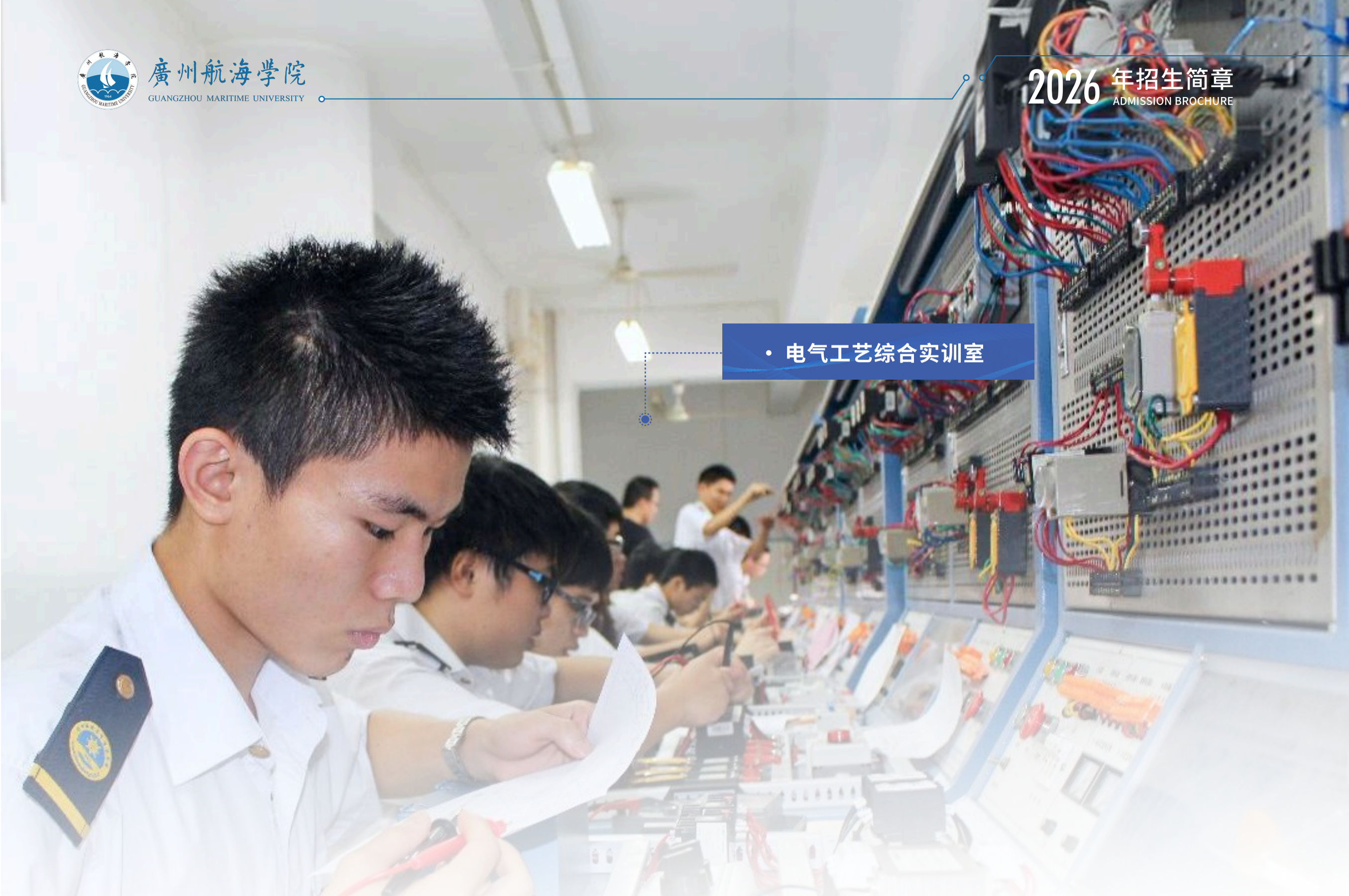
• 电气工艺综合实训室