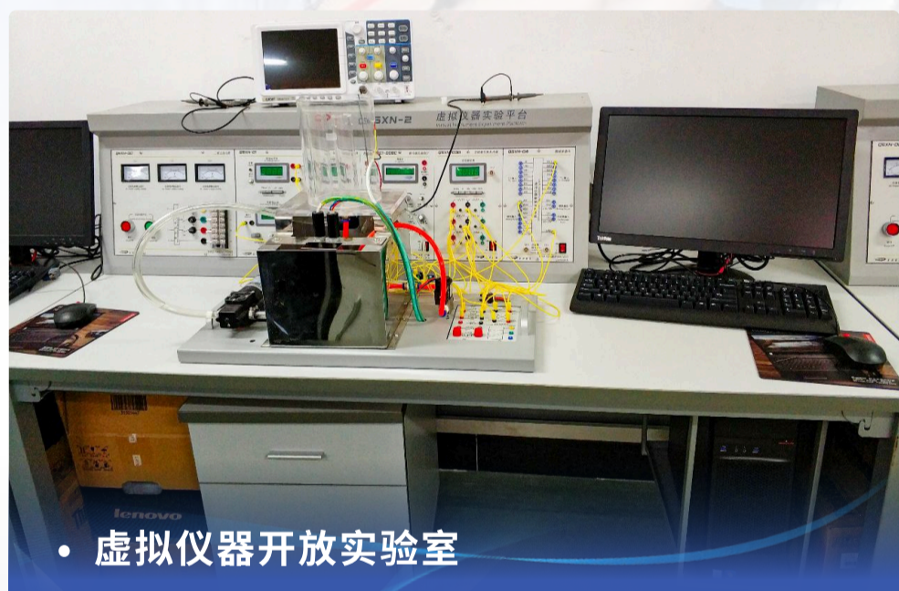
• 虚拟仪器开放实验室