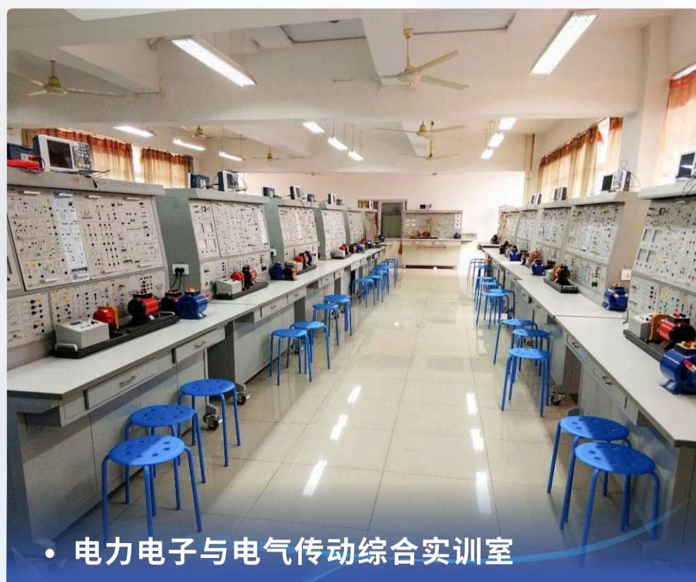
• 电力电子与电气传动综合实训室