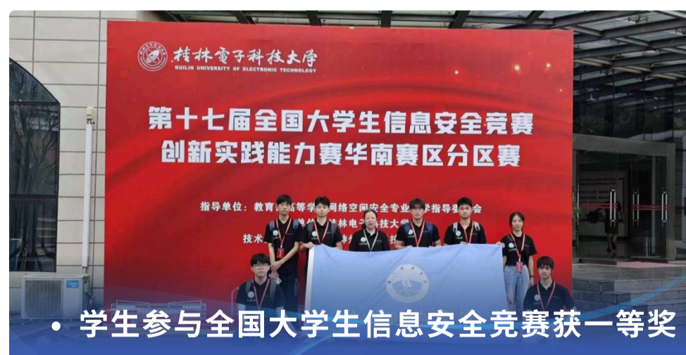
• 学生参与全国大学生信息安全竞赛获一等奖

国家税务总局、公安系统、中国移动通信集团、中国农业银行股份有限公司、中国邮政储蓄银行股份有限公司、富士康科技集团有限公司、海格电气有限公司、广州软通动力信息技术有限公司、网思科技股份有限公司等，以及升学广东工业大学、广州大学、广东技术师范大学、佛山科学技术学院、悉尼科技大学等。