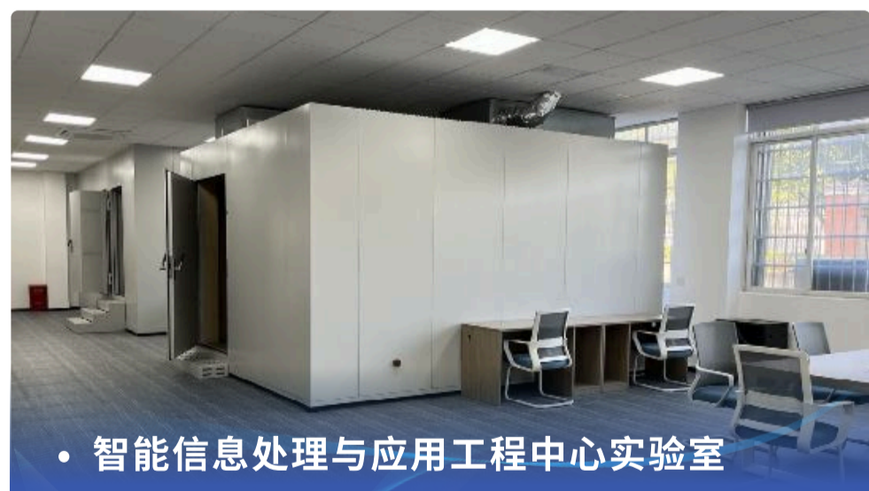
• 智能信息处理与应用工程中心实验室

Web前端框架技术、Java高级框架技术、移动应用开发、机器学习与数据挖掘、深度学习技术与应用、信息安全、交通大数据技术、计算机视觉、大模型基础与实践、嵌入式系统开发、海洋信息系统及海洋应用。