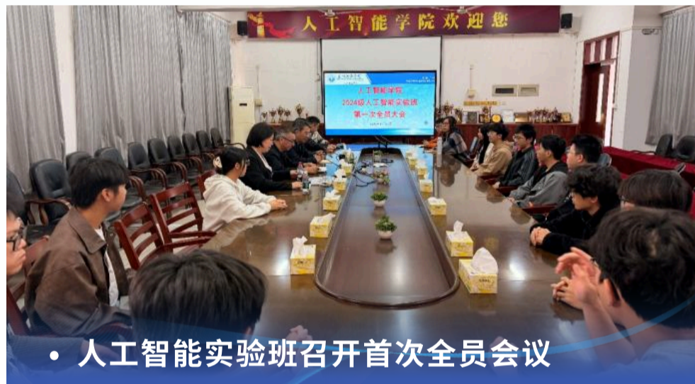
• 人工智能实验班召开首次全员会议

人工智能专业在正常开展招生与教学的基础上，特别面向全院遴选优秀学生组建“人工智能实验班”，已于2025年10月正式启动实施。