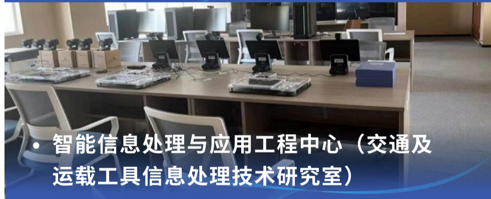
• 智能信息处理与应用工程中心（交通及运载工具信息处理技术研究室）