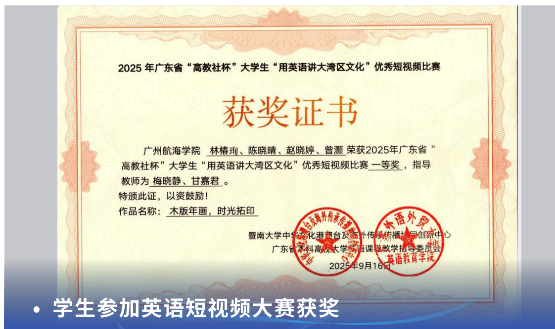
• 学生参加英语短视频大赛获奖