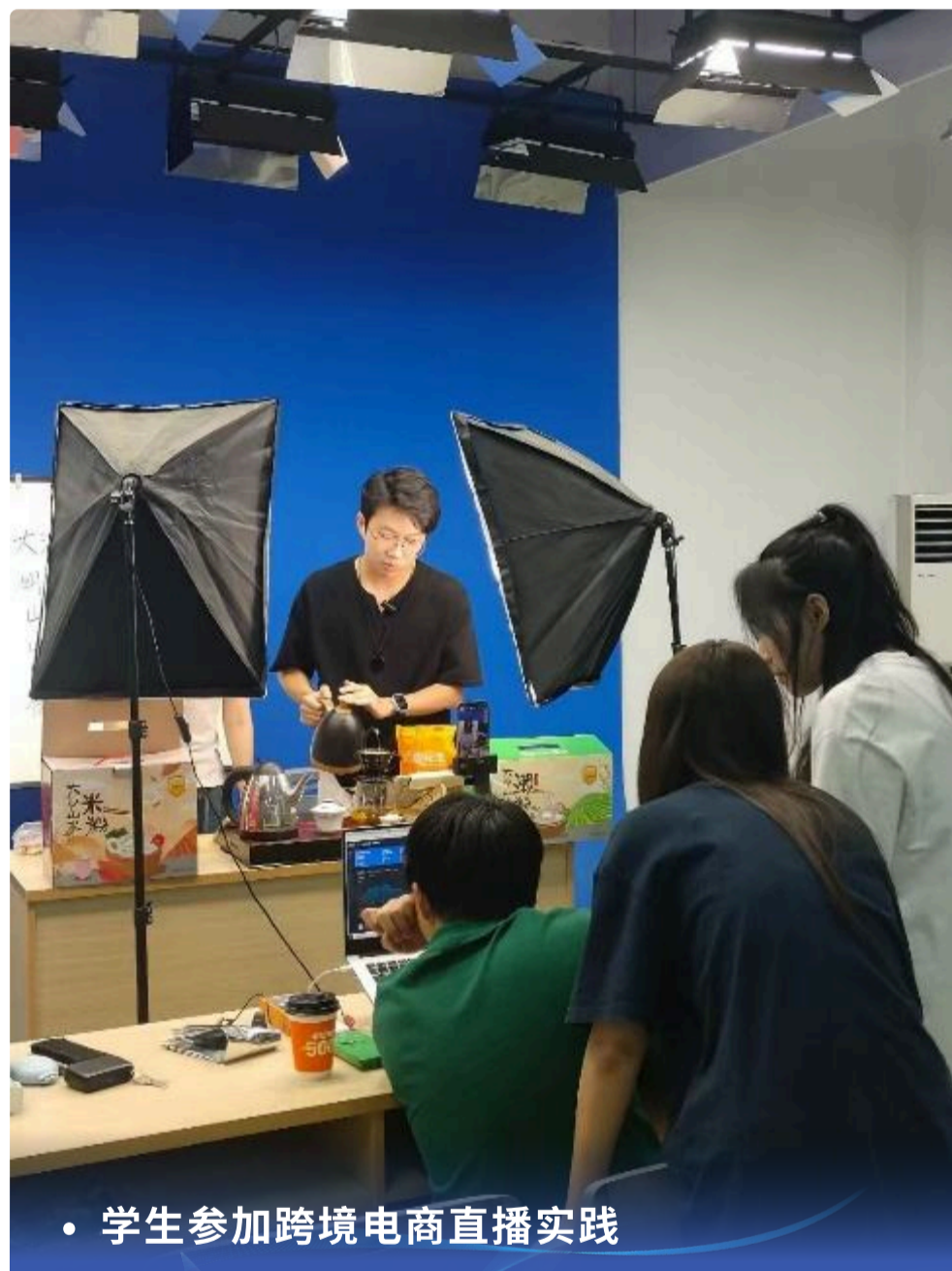
• 学生参加跨境电商直播实践