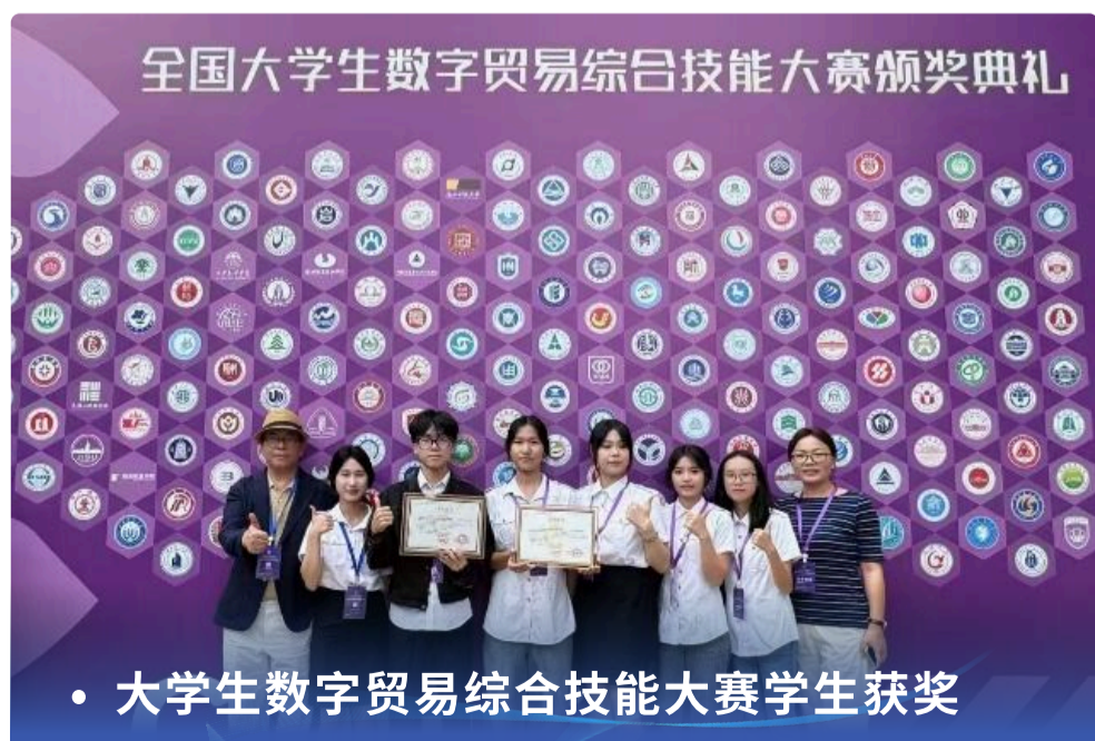
• 大学生数字贸易综合技能大赛学生获奖