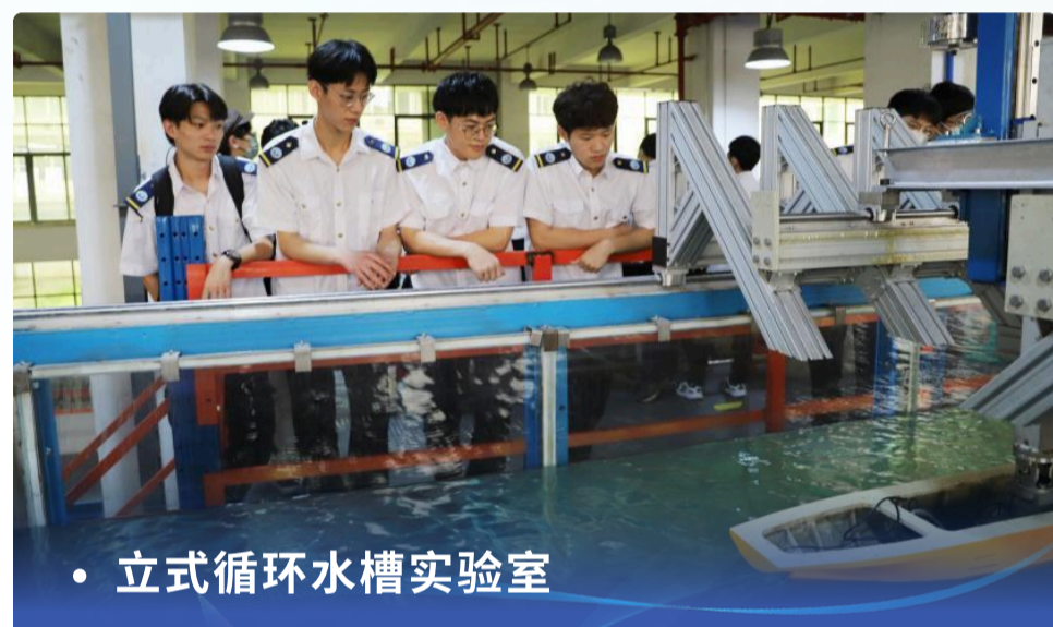
• 立式循环水槽实验室

毕业生可在港口与海洋工程、海洋新能源开发、智慧海洋城市建设等领域，从事智慧港口规划与自动化运维、近岸与海洋结构设计、海上风电与海洋能工程建设、海洋土木工程数字化与智能建造、海岸防灾与生态修复、海洋工程BIM与数字孪生技术应用、海洋大数据分析 with 智能决策、海洋工程装备智能化技术研发等工作；可进入水务、海事、交通等政府部门及事业单位，也可攻读港口海岸及近海工程、海洋工程、智慧海洋技术等相关方向的硕士学位。