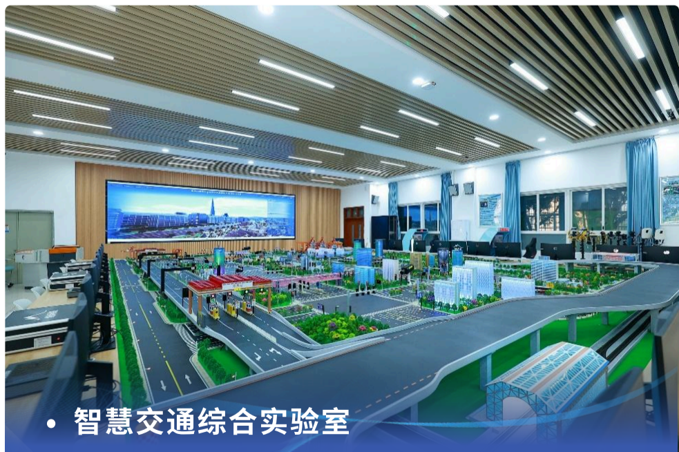
• 智慧交通综合实验室