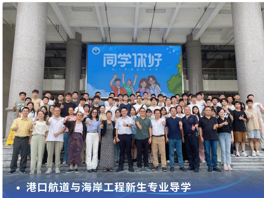
• 港口航道与海岸工程新生专业导学

以培养德智体美劳全面发展的社会主义建设者为目标，注重学生全球视野与海洋情怀塑造，强调理论基础与实践能力和并重。毕业生需掌握工程规划、设计、施工及检测评估等核心能力，重点聚焦智慧港航（智慧码头、航道运维）、智慧水利（抽水蓄能、运河建设）、新兴海洋工程（海上风电、牧场、光伏）三大领域，胜任工程设计与咨询、施工管理与实施、检测评估与运营维护等工作，成为适应未来港口航道与海岸工程行业发展的高素质应用型人才。